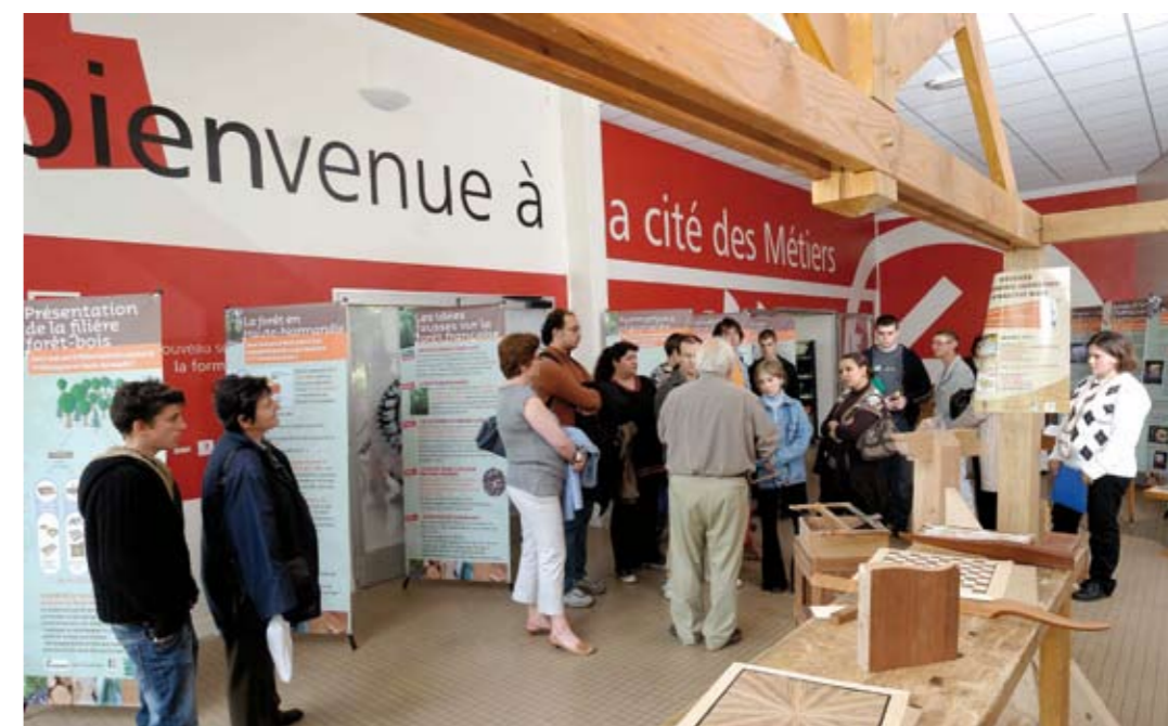
Cité des métiers Haute-Normandie (France)

Sont considérées comme des situations de préfiguration : l'ouverture progressive des pôles, l'organisation de permanences, d'animations permettant le test en grandeur réelle et/ou une montée en charge progressive de l'activité.