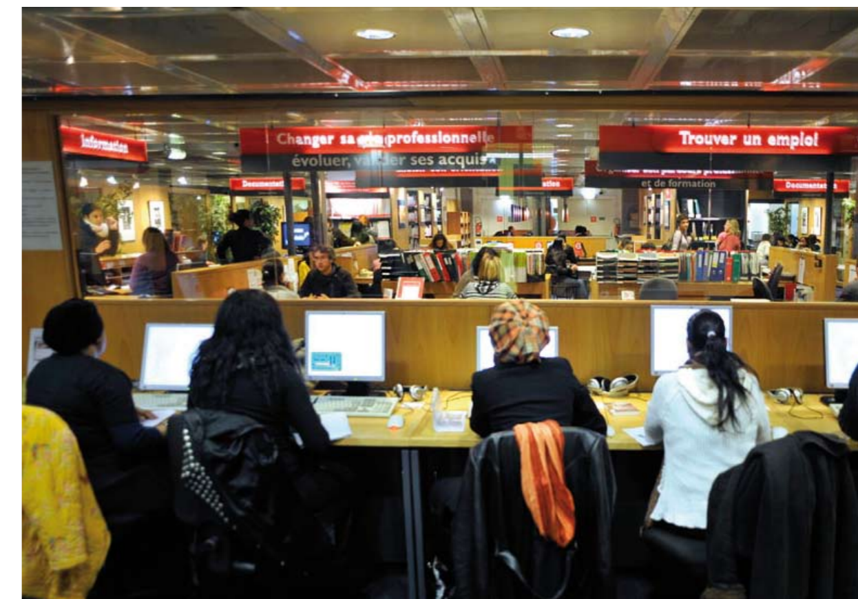
Cité des métiers La Villette-Paris (France)

Afin de proposer des services au plus près de tous les habitants de leur territoire et de réduire ainsi les inégalités d'accès à la formation et à l'emploi entre les différentes populations, les Cités des métiers ont développé différentes stratégies. En plus d'organiser des événements délocalisés et développer des accès diversifiés via internet, plusieurs d'entre elles ont souhaité démultiplier leurs lieux d'accueil physique des publics. Deux schémas ont été expérimentés : le premier a consisté à ouvrir des "centres associés" autour de la Cité des métiers fonctionnant alors localement comme tête de réseau. Ils ne proposent pas le même niveau de service mais fonctionnent comme relais locaux de l'offre. Le second schéma a consisté à dédoubler à l'identique la Cité des métiers en créant une ou plusieurs, offrant chacune, dans des "sites" géographiques différents, la totalité des services.