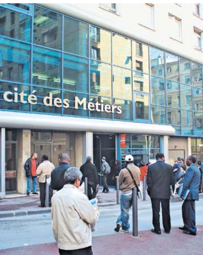
Cité des métiers Marseille-PACA (France)

Le terme de "centre associé" est utilisé lorsqu'une plate-forme n'offrant qu'une partie des services d'une Cité des métiers vient compléter l'offre de service d'une Cité des métiers mère sur son territoire. Le centre associé n'est pas nécessairement un espace dédié, mais peut être implanté dans une structure qui, en plus de ses services habituels, est organisée en point-relais de la Cité des métiers.