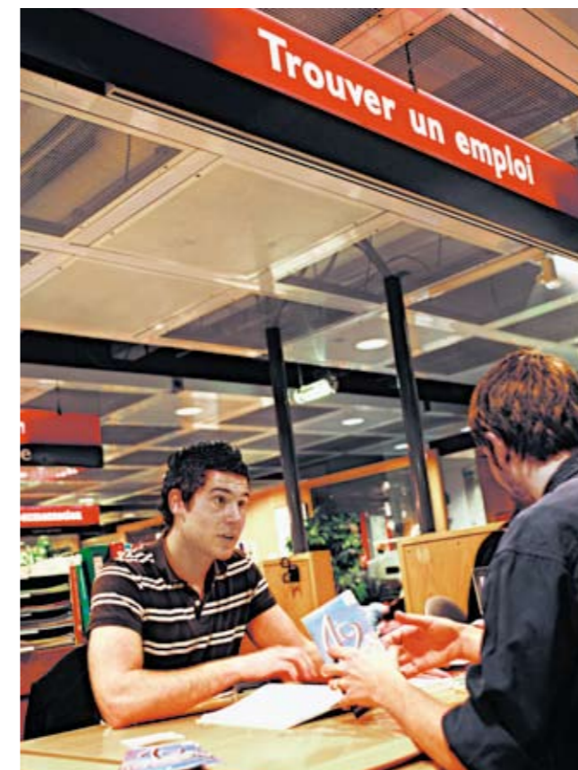
Cité des métiers La Villette-Paris (France)

L'objectif d'autonomisation des usagers est ce qui justifie l'existence d'une Cité des métiers. L'entretien doit aider l'usager à construire des stratégies d'action. Pour qu'il y ait véritablement conseil, il ne peut y avoir d'enjeu, de contrôle, de décision du conseiller pris à la place de l'usager.