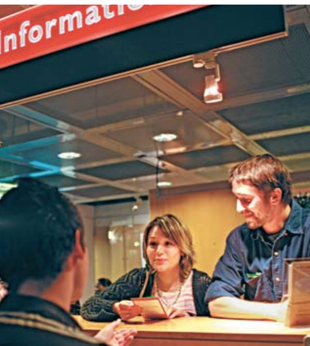
Cité des métiers La Villette-Paris (France)