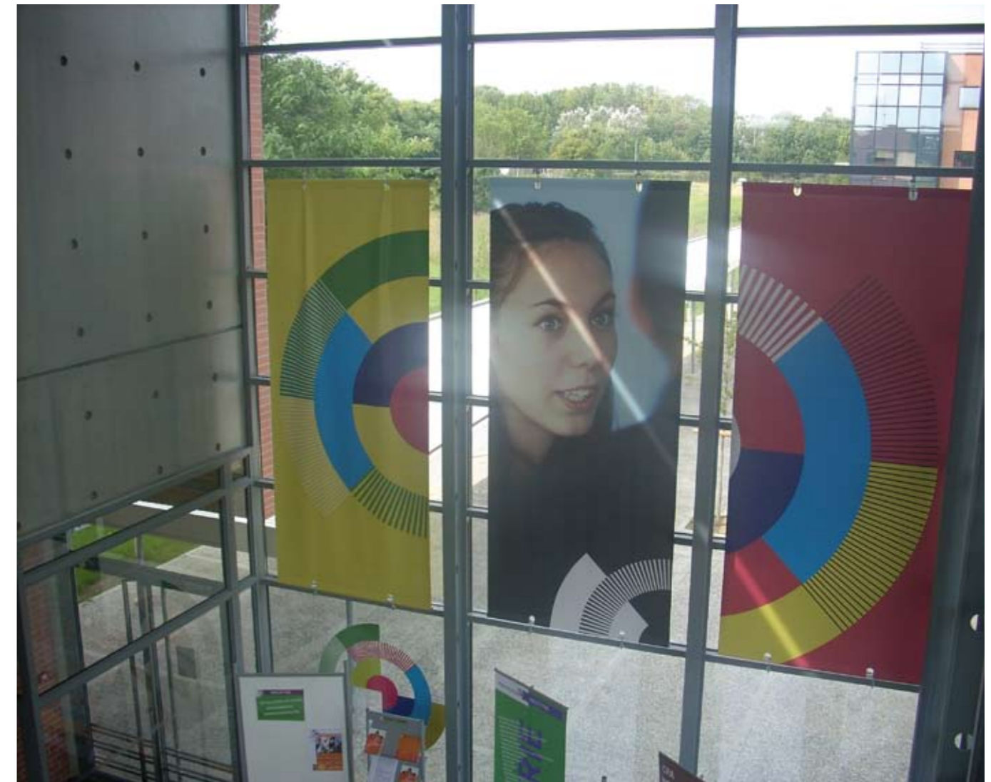
Cité des métiers Seine-et-Marne (France)

Les conseillers doivent être volontaires pour participer à une structure multipartenaire qui, bien souvent, bouscule les comportements et fonctionnements professionnels habituels de chaque institution. Un effort constant de mutualisation doit être mis en place afin de garantir l'efficacité de la coopération.