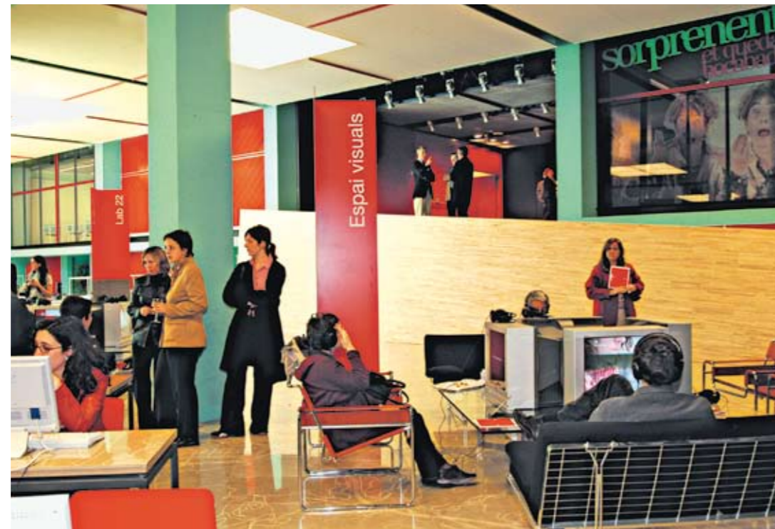
Cité des métiers Barcelone (Espagne)

Une des spécificités des Cités des métiers est de construire une offre et un projet à partir des préoccupations réelles des publics et le moins possible à partir de tel ou tel découpage institutionnel ou politique. Elles se définissent donc en fonction des bassins d'emploi et de vie des habitants.