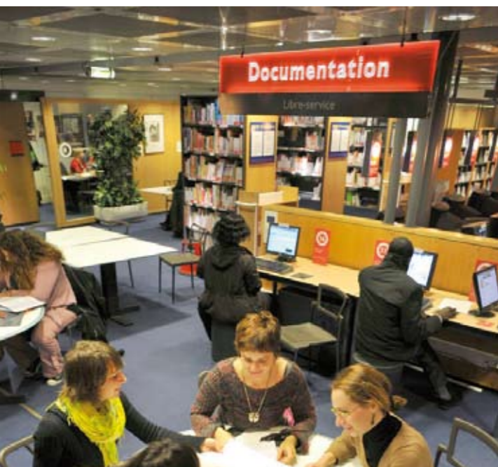
Cité des métiers La Villette-Paris (France)

Si la Cité des métiers regroupe en un même lieu des spécialistes aux compétences différentes, les services qu'ils offrent vont au-delà d'une simple addition de prestations existantes. Les conditions d'entretien, la complémentarité entre prestations et ressources et la nécessaire mutualisation exigent des actions de formation au service de cette coopération. Chaque année, les institutions partenaires feront remonter les besoins de formation des conseillers et décideront d'actions communes venant compléter leur propre plan de formation.