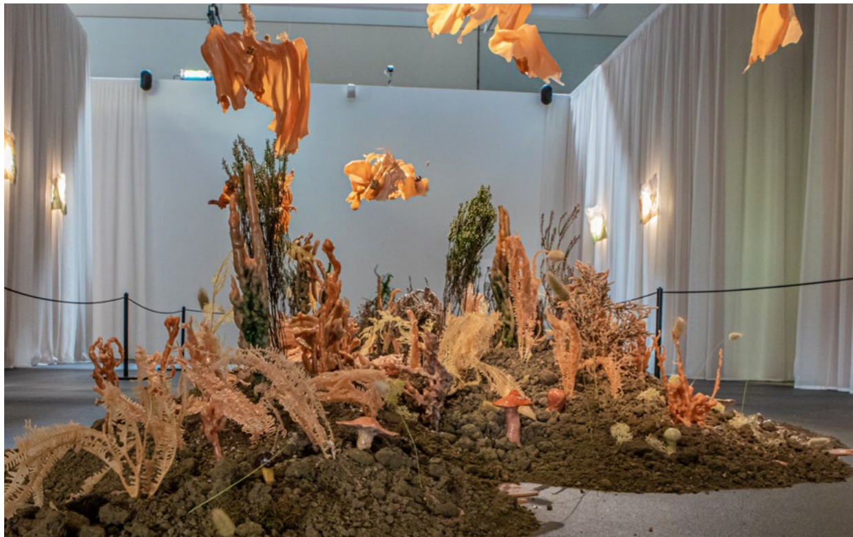
La Pudeur des Mycètes Marine Nouvel, 2023.